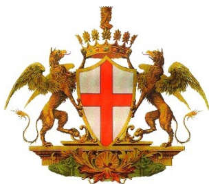
Comune di Genova

Con il Patrocinio del Municipio VII Ponente