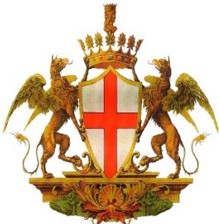
Comune di Genova

Con il Patrocinio del Municipio VII Ponente